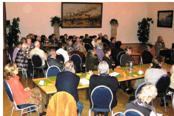
Der gut gefüllte Saal beim Videovortrag